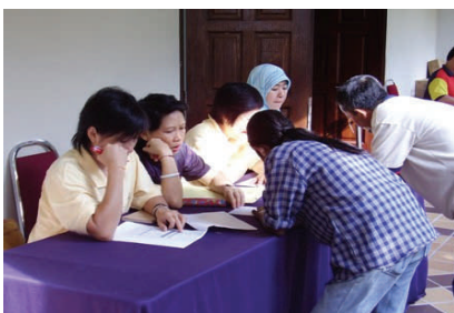
Registration desk busy with participants registering