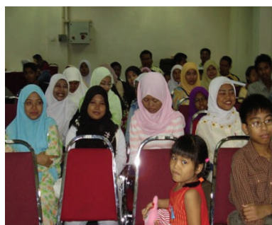
Waiting patiently for AGM to commence...