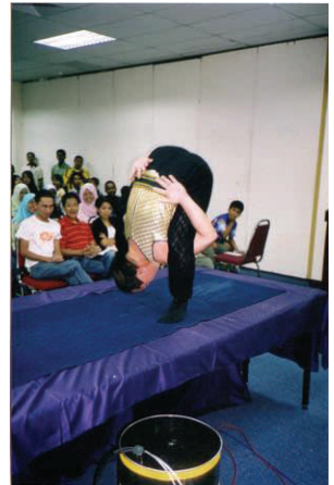
Plastic man strutting his stuff.

The AGM ended with a presentation by the Penang Thalassaemia Boria group, a plastic man show and light refreshments were served.