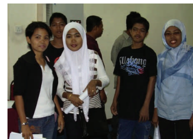
Some of the participants posing for the camera.